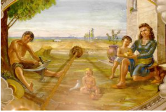
Soffitto salone famiglia