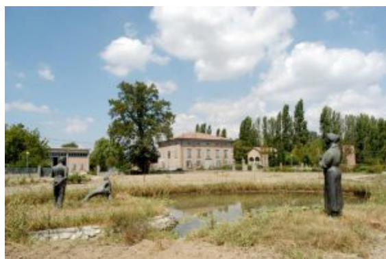
La casa grande

A casa dopo un po’ videro rientrare il calesse senza il capofamiglia. Era stato ucciso in via del curato da briganti. La Comunità fu vicina alla famiglia Forni in quell’episodio così tragico e simile al fatto ricordato dal pascoli in una sua poesia.